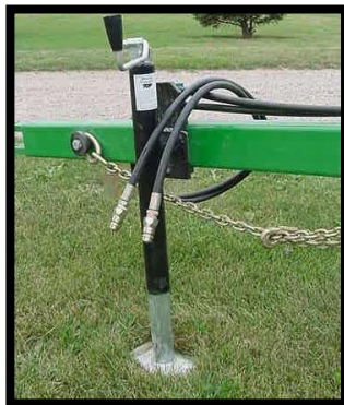
Chaîne de sécurité pour cric de langue