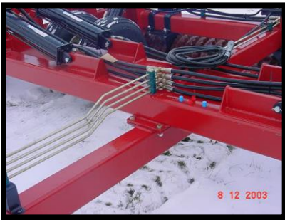
Toute la plomberie est soigneusement arrangée et attachée