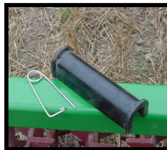
Serrure à cylindre