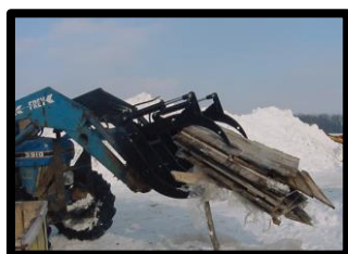
Bûches et dalles

Le grappin polyvalent Big Jim est disponible avec des supports de fixation rapide Frey, Alo, Skid Steer et des supports de goupille universels (goupille de 1" de diamètre). Le grappin se compose de dents de \frac{3}{4} " d'épaisseur x 5" de profondeur. Les dents sont attachées ensemble avec une barre ronde de 1\frac{3}{4} " et 1" de diamètre et renforcées avec un tube mural de 4" x 2" x \frac{1}{4} " à l'arrière du grappin. Les dents sont espacées sur des centres de 12 pouces pour permettre à la saleté de passer à travers mais ramassent toujours les branches, les racines et de nombreux autres objets. Plusieurs options de griffes différentes sont disponibles pour répondre aux besoins spécifiques des clients.