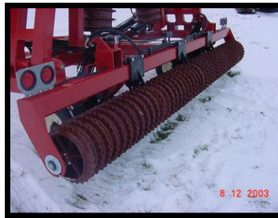
5 bearing main frame section, lights & reflectors standard