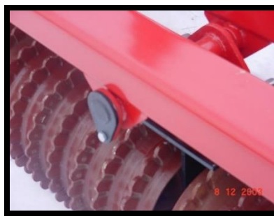
Axes de charnière robustes de 1 3/4", solidement fixés