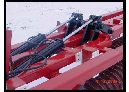
Rugged 4 beam main with section with two cylinders