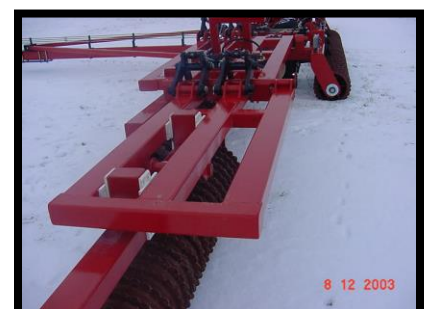
Section d'aile extérieure à 3 faisceaux avec deux cylindres, chaque groupe de packer oscille sur l'axe central et les plaques d'usure en plastique