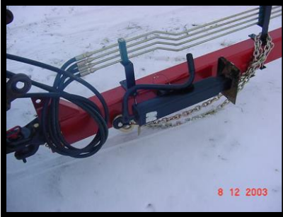
Adjustable clevis hitch, safety chains, 7000 lb tongue jack, steel hydraulic lines