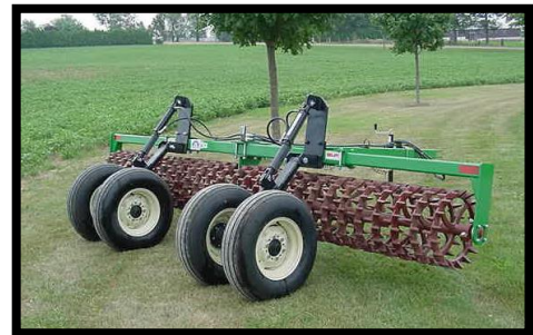
Montré avec le kit de transport à deux roues