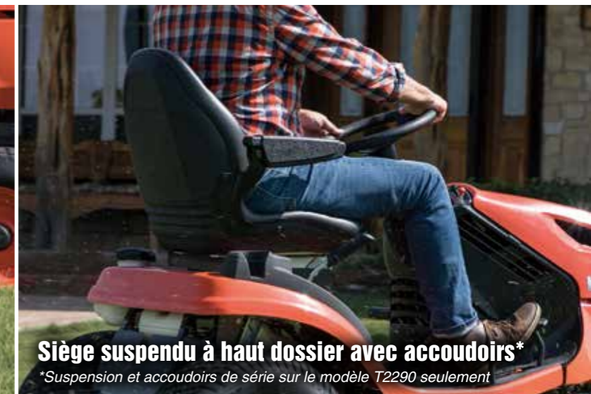
Siège suspendu à haut dossier avec accoudoirs*

*Suspension et accoudoirs de série sur le modèle T2290 seulement