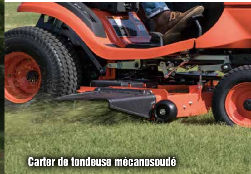
Carter de tondeuse mécanosoudé

Montez sur le Kubota série T et vous aurez tout ce que vous voulez dans un tracteur de pelouse de haut de gamme. Plus de confort pour rester détendu et frais. Plus de commodité pour faciliter le travail. Plus d'efficacité pour faire le travail plus vite. Et, bien sûr, plus de fiabilité et durabilité Kubota pour que votre série T continue de faire ce que la série T fait le mieux : rendre votre pelouse plus belle.