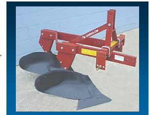
Available in two furrow Disponible à 2 versants