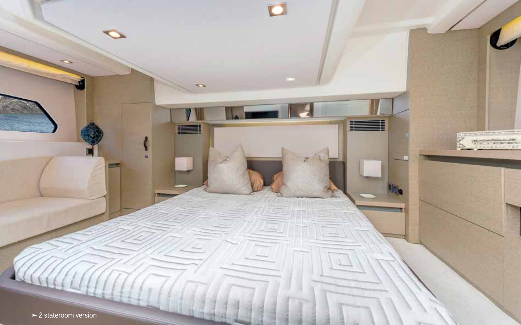
► 2 stateroom version