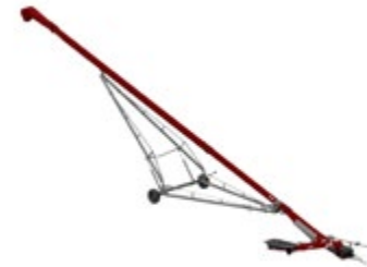
20-80 AVEC PIVOTEMENT