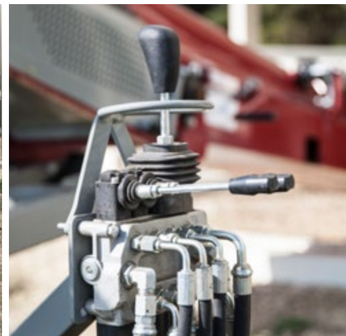
Commandes pratiques par manette