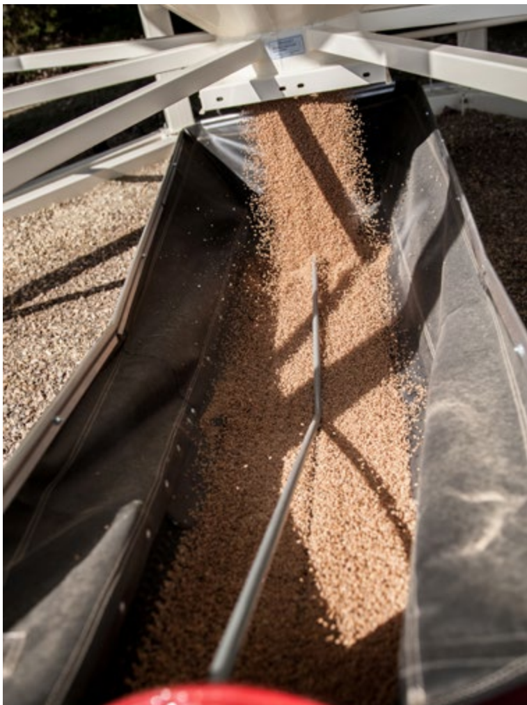
Puit d'entrée de la trémie repliable

Protégez l'intégrité de vos semences et de vos céréales ou déplacez votre engrais grâce aux convoyeurs Meridian. Profitez de la manipulation rapide et en douceur de vos marchandises grâce à une courroie Chevron de 20 po dans un tube de 10 po. L'entraînement en forme de S basse tension permet à la courroie de 20 po de suivre les contours du tube. Conception entièrement fermée du retour de la courroie, qui protège la courroie contre les éléments et élimine la nécessité d'un système de poutrelle.