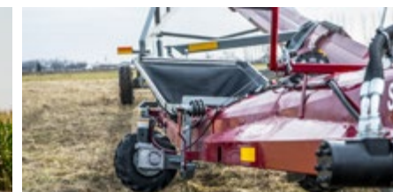
Trémie pivotante disponible (modèles de remplissage de silos)