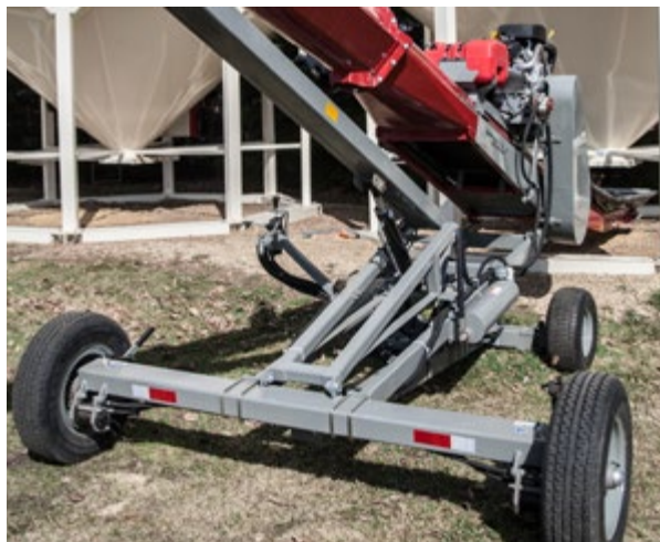
Chariot de déplacement solide