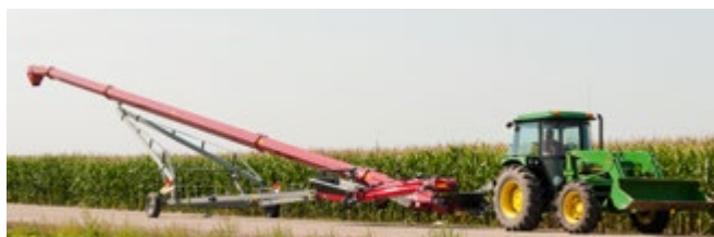
Conception sans armature