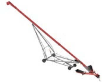
20-80 AVEC PIVOTEMENT ET CHARIOT DE DÉPLACEMENT