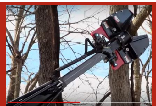
Model TC6451 Telescopic Clipper head with 36" telescope. Ideal for clean-up along ditches and waterways.

Excellent pour nettoyage après tempête, ou un dégagement immédiat. Rotation de la tête de coupe jusqu'à 180° permet d'enlever les hautes branches. Dégager les abords de clôtures, les emplacements commerciaux ou résidentiels avec le coupe-arbre, au ras du sol. Coupe arbres, branches mortes ou vivantes, jusqu'à 9" de diamètre. Coupe facilement le bois de chauffage sans l'usage d'une scie à chaîne. Travail sécuritaire sur terrain inégal. Peut s'utiliser avec la majorité des tracteurs ou chargeurs Skid. 2000 PSI minimum exigé.