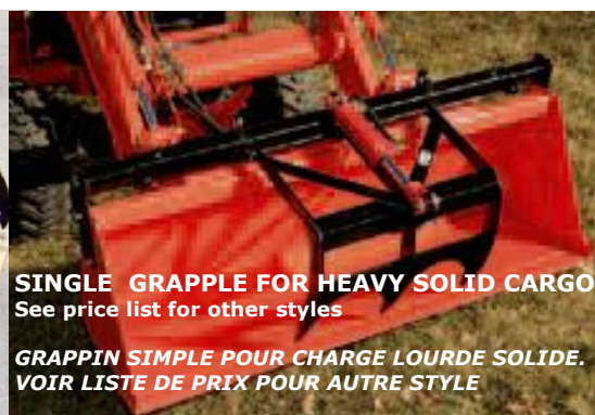
SINGLE GRAPPLE FOR HEAVY SOLID CARGO See price list for other styles

GRAPPIN SIMPLE POUR CHARGE LOURDE SOLIDE. VOIR LISTE DE PRIX POUR AUTRE STYLE