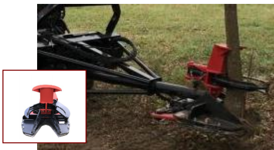
CLAMPER for tree Clipper with Hardened T1 Clamping Blades. Greased Pivot Points. Backstop to prevent tree from falling back Center Load Support on new models. Welded Clamping Cylinder

Extra sets of hydraulic outlets X-TRA VALVE KIT