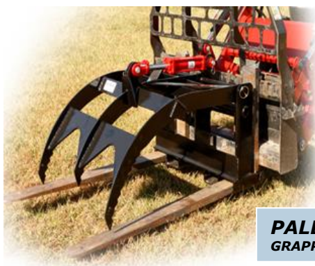
PALLET FORK GRAPPLE GRAPPIN FOURCHE À PALETTES

Retient solidement les lourdes, volumineuses ou encombrantes charges pour un transport sécuritaire. Le grappin double est idéal pour les charges volumineuses, difficiles à manipuler.